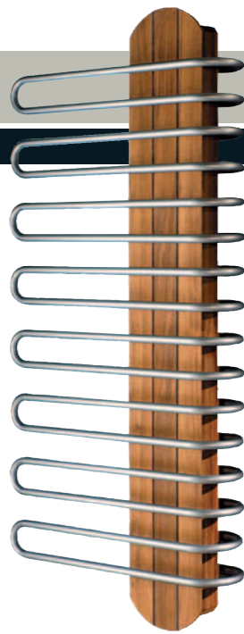
3 versions : Eau Chaude, Electrique, Mixte 2 hauteurs 1348 & 1924 mm Largeur 600 mm Puissance à partir de 707 W PPI * : 1061 €