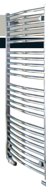
3 versions : Eau Chaude, Electrique, Mixte 5 hauteurs 1222, 1537, 1657, 1807 & 1927 mm 3 largeurs 500, 600 & 750 mm Puissance à partir de 395 W PPI * : 833 €