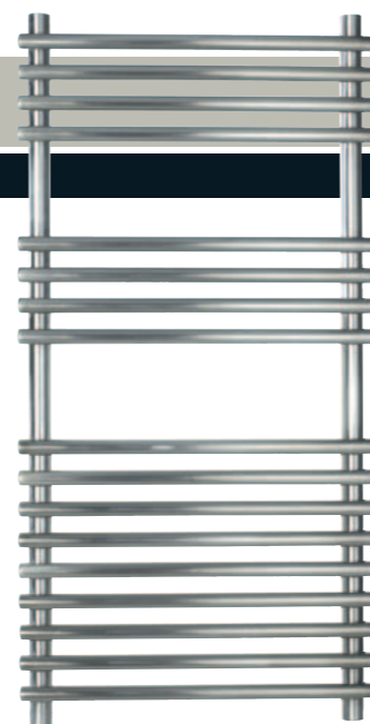
Version Eau Chaude 2 hauteurs, 1200 & 1500 mm 2 largeurs 500 & 600 mm Puissance à partir de 406 W PPI * : 810 €