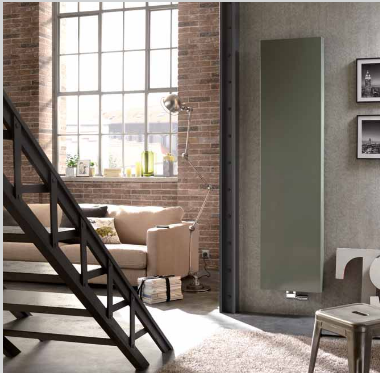
PLAN Vertical - Version Eau Chaude - H 1800 x l 450 x P 111 mm - Puissance : 1329 W - RAL7033 - Prix : 726€* existe également en profondeur 136 mm

Du côté de la puissance de chauffe, le choix est également très large - de 200 à 5000 W selon le modèle - afin de délivrer la chaleur la plus adaptée au volume.